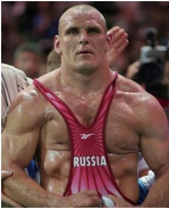
Александр Карелин ( греко-римская борьба)

Благодаря комплексу ГТО были выявлены талантливые и ставшие впоследствии всемирно известными спортсмены.