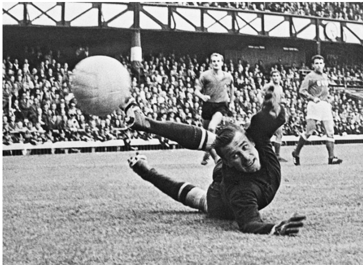
Лев Яшин (футбол)