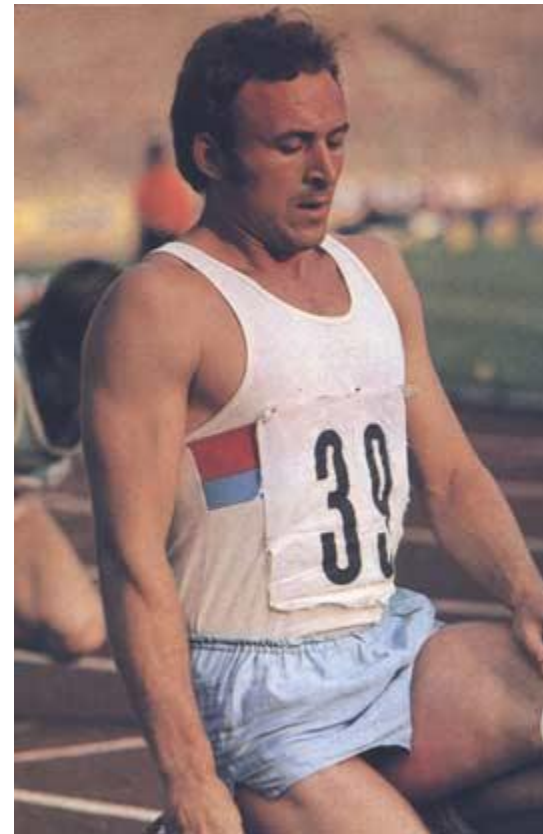
Валерий Борзов (легкая атлетика)